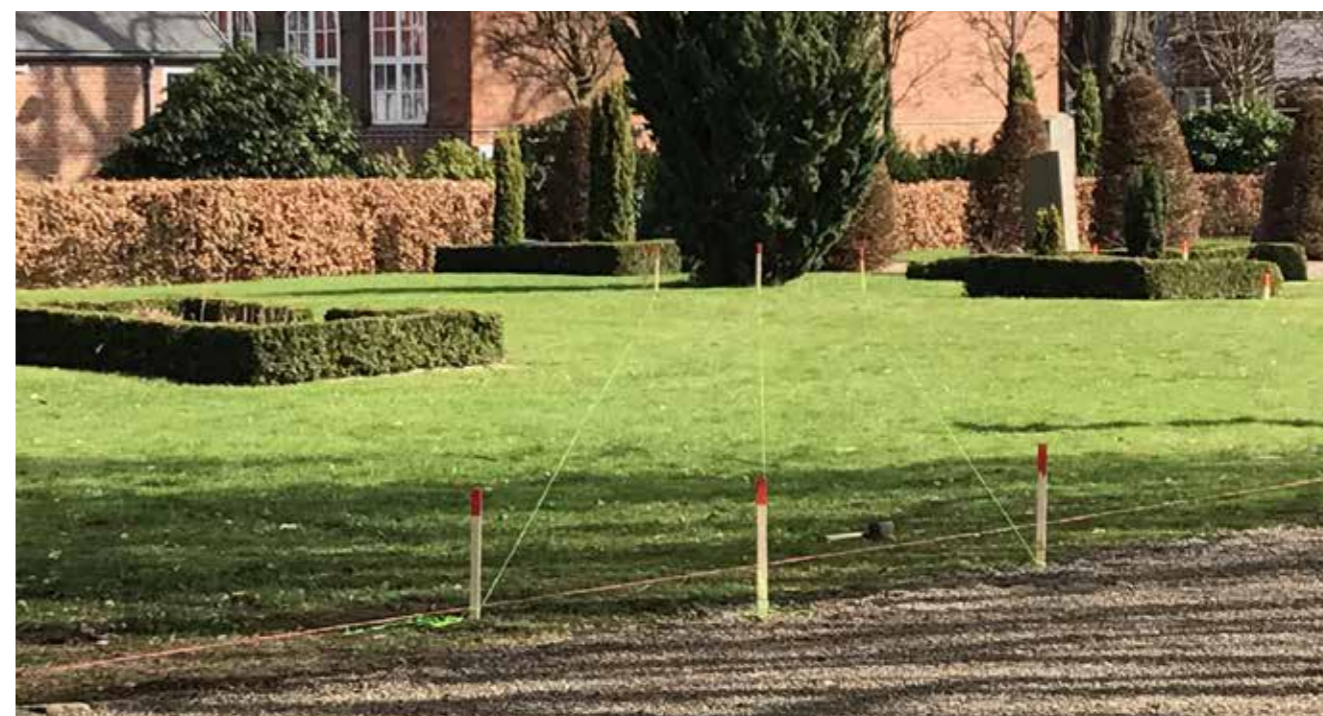
Praktikanternes opmåling af staudehaven på Gamle Kirkegård i Vejle.