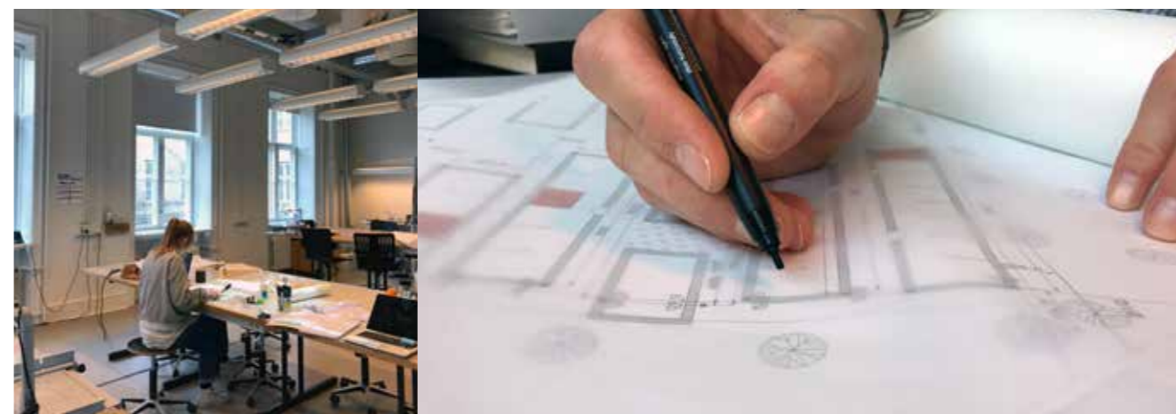
En bachelorstuderende i arbejde – Staudehaven projekteres.

Vejle Kirkegårde lagde i foråret 2017 i 8 uger, kontor til 2 studerende som fik stillet et afsnit til rådighed på Gamle Kirkegård i Vejle, til etablering af en ny urneafdeling. Opgaven bestod i at tegne, opmåle og beskrive projektet, samt formidle ideen og drifts målene til gartnerne. De sid-