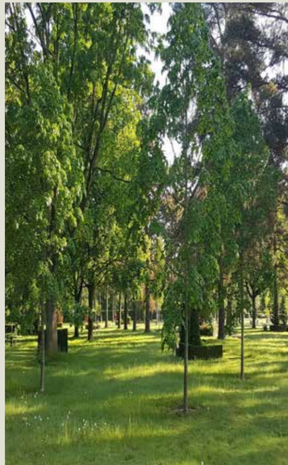
Træer på Assistens Kirkegård, Vestre.

I 2014 plantedes på Assistens og Dalum Kirkegård 200 store allétræer af primært hjemmehørende arter. Plantningen er et led i kirkegårdens udvikling mod større biologisk mangfoldighed og ekstensiveret drift på Assistens Kirkegårds vestre del mod Odense Universitetshospital.