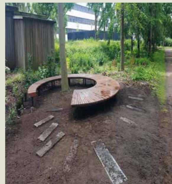
Specialdesignede plinte i rammeplantning mod OUH.

For at sikre årstidsvariation, blev der primært ved opholdsrummene lagt 6.624 blomsterløg og plantet 3.252 stauder.