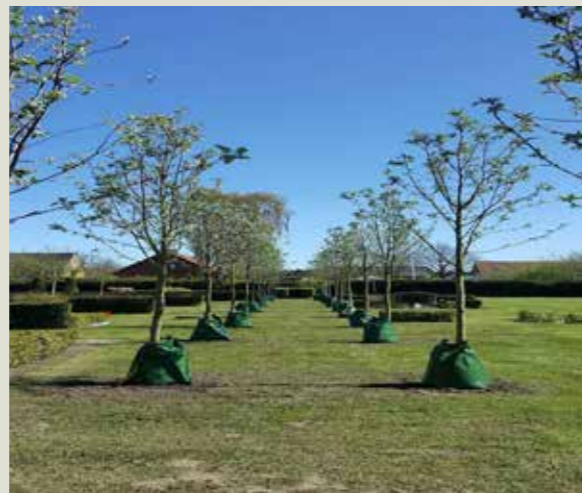
Ny allé af røn, Korsløkke Kirkegård.