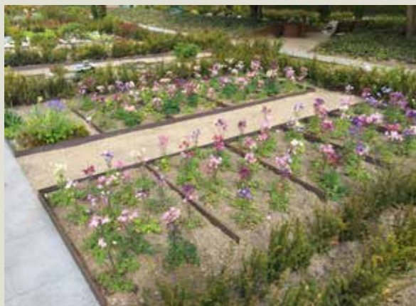
Urnegrave med rammer af cortenstål. Ledige gravsteder tilplantes med stauder.