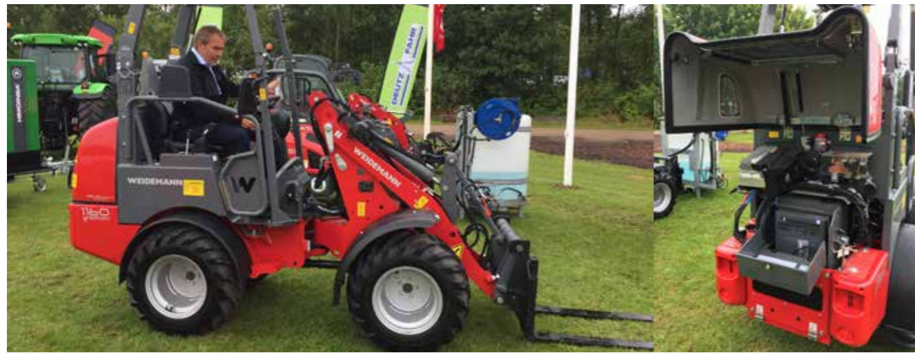
Weidemann 1160 eHoftrac er en batteridrevet minilæsser, med et lydniveau på 92 dB. Drift tiden er 1½ - 4 timer efter 8 timers opladning. Køremotoren yder 6,5 kW og vægten er ca. 2 tons.