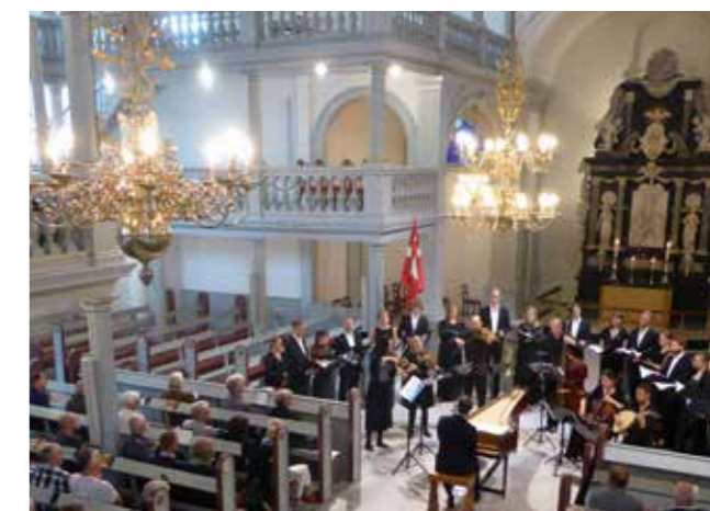
Holmens Kirkes Kantori og Barokensemble stod for afslutningskoncerten i Garnisons Kirke.