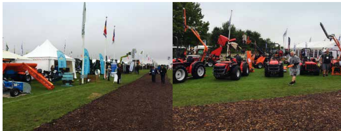
Årets Have- og landskabsudstilling satte ny rekord med 278 udstillere og 11.259 besøgende, trods det våde vejr.