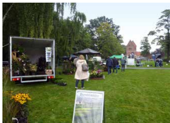
Der var god tid til at se kirkegården og den udendørs udstilling på Gladsaxe Kirkegård.