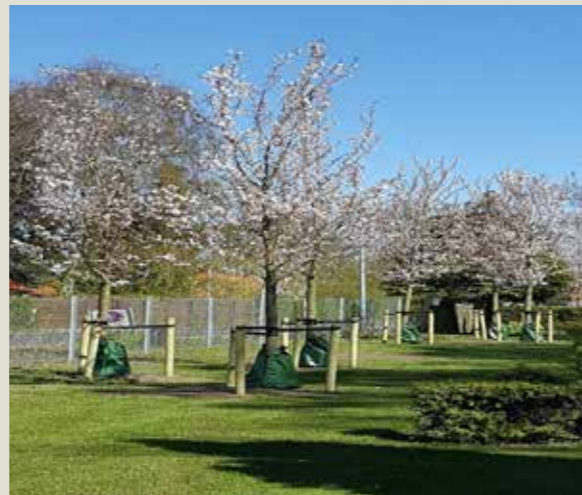
Prunus 'Amber Beauty', Korsløkke Kirkegård.

I 2016 plantedes 133 store allétræer primært på Korsløkke og Fredens Kirkegård. Plantningen er et led i kirkegårdens udvikling og at skabe rum og biologisk mangfoldighed på kirkegårdene.