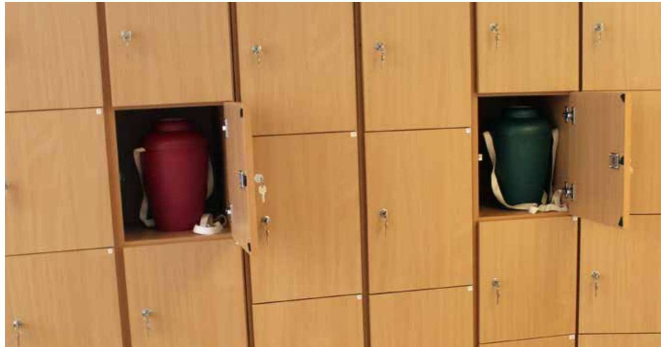
Kirkegården skal opbevare urner under forhold, der er sømmelige, og på en sådan måde, at beskadigelser og forvekslinger undgås. Urneskab, Hørsholm Kirkegård.