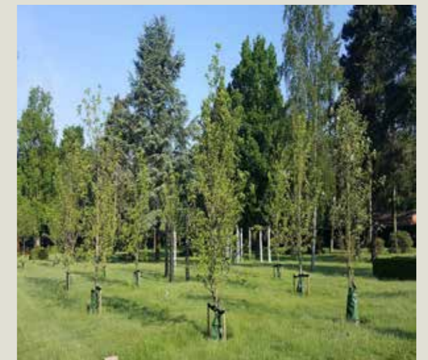
Fælledgræs under fritvoksende træer på Assistens Kirkegård, Vestre.

Det er primært i afdelingerne med Fælledgræs, der er plantet træer i 2013. Herved opnås en frodighed som giver ro og fremstår harmonisk på de åbne arealer mellem Kirkegårdskapellet og OUH.