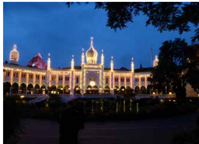
Onsdagens program blev afsluttet med en middag i Tivoli.