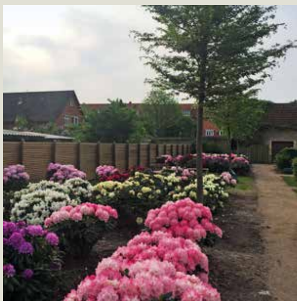
Fredens Kirkegård, nyplantede rhododendron og bøg.

Der etableredes samtidig nye bænkepladser med halvcirkulære Krum-8 bænke fra G9. En ny ukendt kistefællesgrav blev samtidig anlagt, hvor der tidligere var traditionelle kistegravsteder. To træækker af prydkirsebær i en staudbund indrammer kistefællesgraven.