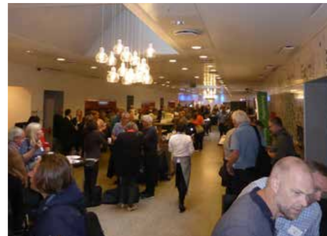
I pauserne mellem foredragene var der rig mulighed for at besøge den indendørs udstilling i hotellets forhal.

Konceptet for begravelsespladsen integrerer kirkegården med det omgivende landskab og dens beboere. Der vil herved blive skabt en plads for levende og døde. Järvafältet skal være en moderne kirkegård integreret i et multietnisk kulturresevat til rekreative formål med en høj grad af kunstneriske værdier.