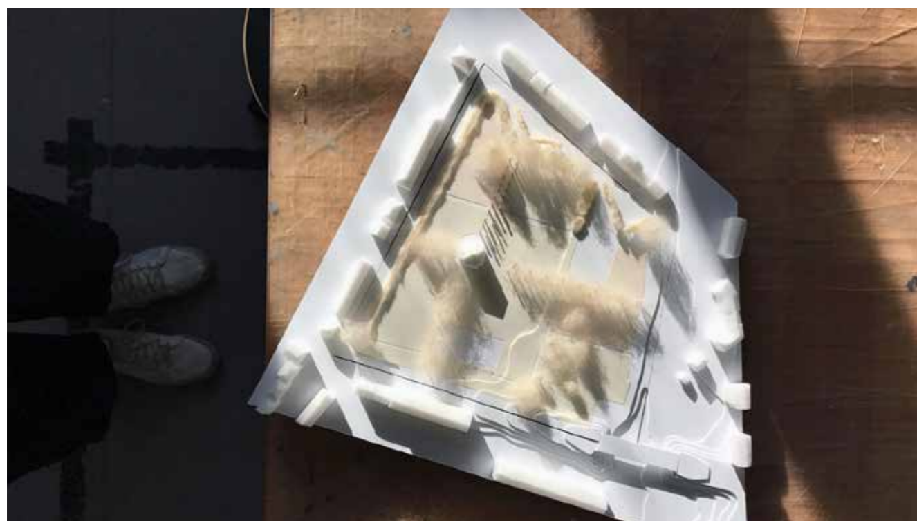
En af flere modeller der blev udarbejdet til Bachelorprojektet over Østre kirkegård.

Tekst og foto: Jens Zorn Thorsen, jzt@vejle-kirkegaarde.dk