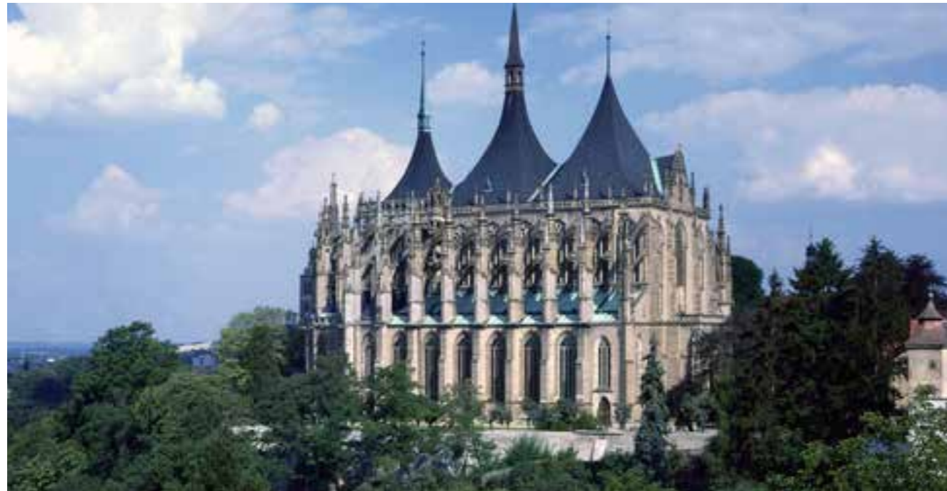
St. Barbara - Katedralen i Kutná Hora

Billederne er vist med tilladelse fra Czech Tourist Authority - Czech Tourism