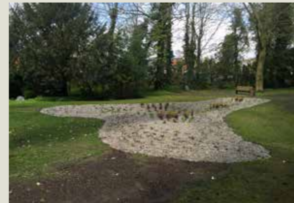
Vandhul i afd. BØ, Skovkirkegården, Assistens Kirkegård.

Afdelingen er desuden fornyet med 23 store, nye rhododendron (Ø 100 cm.), ligesom der er fældet enkelte træer, primært grundet stormskader.