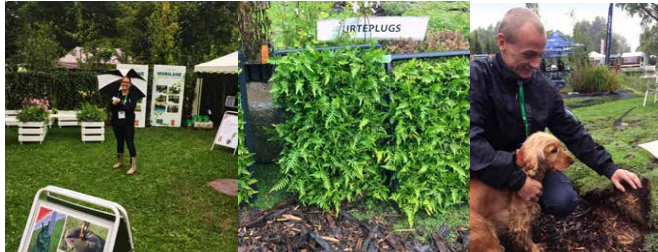
Planter produceres og sælges både enkeltvis, kassevis og i metermål.