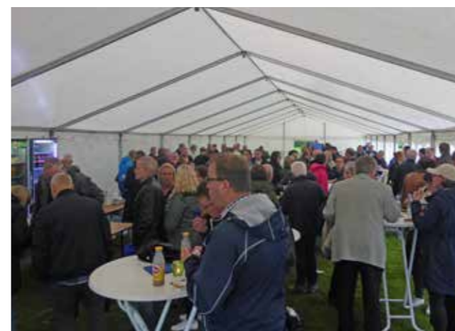
Det dårlige vejr var med til at øge 'omsætningen' i madteltet.